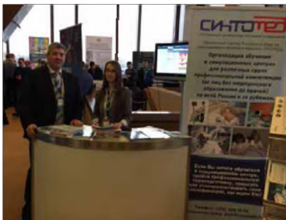
Стенд компании СИНТОМЕД на XIX съезде РОЭХ (Москва, 2016)

Члены общероссийской общественной организации «Российское общество симуляционного обучения в медицине», РОСОМЕД неоднократно ставили данный вопрос перед Правлением общества, поэтому было решено разработать единую, централизованную систему интеграции центров.