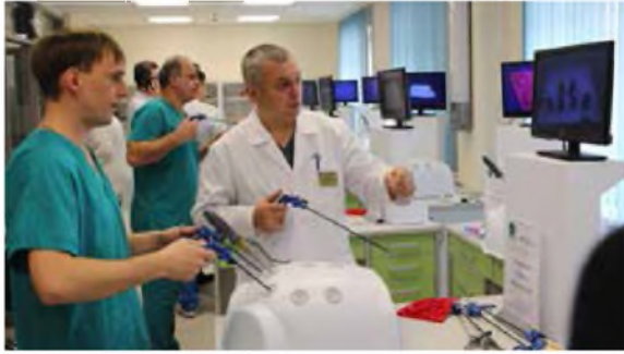
Тестирование эндохирургических навыков на корпоральных симуляторах