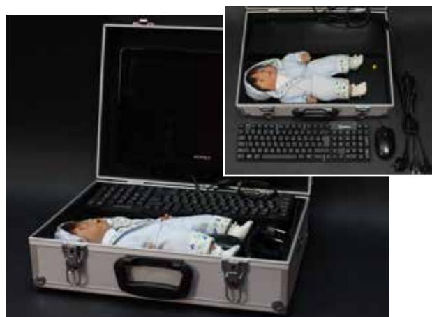
Илл.1. Внешний вид аппаратно-программного комплекса

Конструктивное решение выполнено в виде переносного компактного варианта, размещенного в кейсе. Внутри кейса находится манекен - силиконовая кукла, соответствующая по размерам грудному ребенку, блок генерации изображения и оптический блок, соединенные с компьютером пользователя (илл.1).