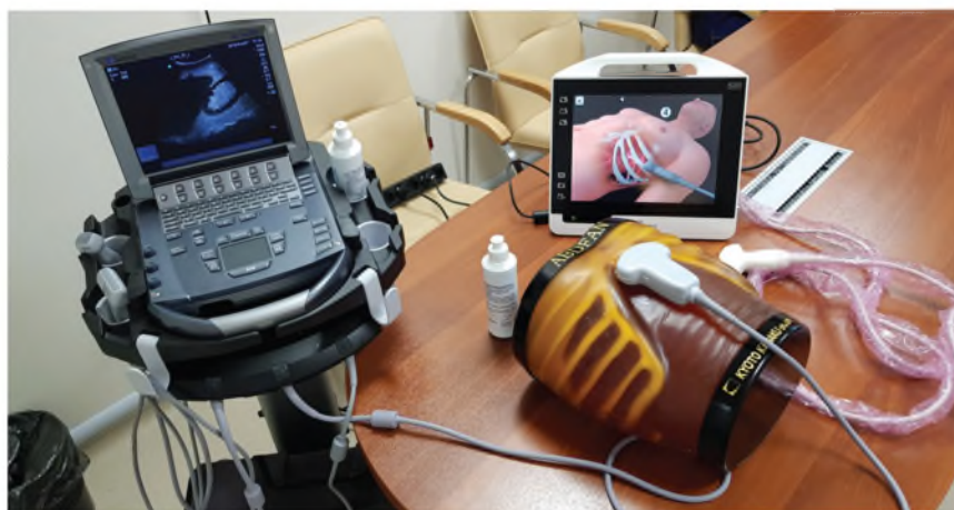
Медицинское и симуляционное оборудование для проведения тренинга по протоколу eFAST

Интеграция программ обучения основанных на международных протоколах поднимает профессиональные навыки врачей, что в свою очередь является мощным стимулом к непрерывному образованию медицинских работников. Использование ультразвуковых технологий в ежедневной практике позволяет избежать множества диагностических ошибок, а ультразвуковая навигация при инвазивных манипуляциях значительно снижает количество осложнений и позволяет повышать качество оказания медицинской помощи населению. Особенно перспективно выглядит интеграция подобных протоколов для проведения медицинской сортировки на месте чрезвычайной ситуации [18-20].