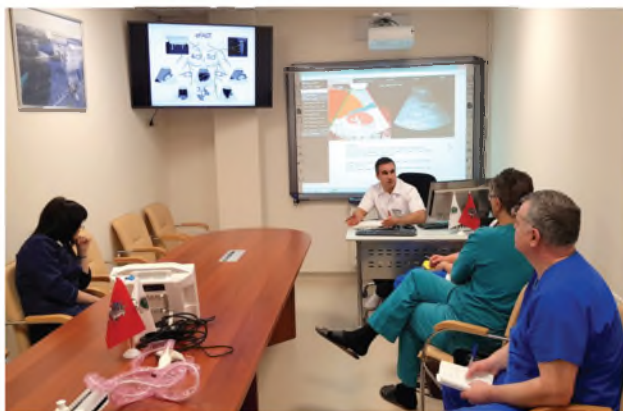
Теоретическая часть занятия по отработке протокола eFAST

врача. При подготовке данной программы использовалась современная литература, основанная на доказательной медицине, а также зарубежный опыт обучения специалистов.