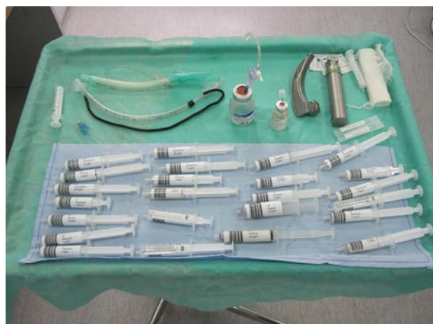
Рис. 4. Столик анестезистки с набором «фармакологических препаратов» - шприцев со штрих-кодом для автоматического распознавания введенного лекарства

У курсантов имеется возможность выбрать тот или иной вариант индукции в анестезию. В большинстве случаев врачи используют пропофол и фентанил. После достижения эффекта гипнотика и анальгетика в условиях миорелаксации интубируют трахею и выставляют параметры вентиляции. Перед курсантами находится «стол анестезистки», где представлены различные лекарства. Также там имеются ларингоскоп, эндотрахеальные трубки и ларингеальные маски (рис. 4). Создается полная иллюзия рабочего места анестезиолога и возможность выбрать тот или иной препарат в соответствии с предпочтениями врача или особенностями заболевания.