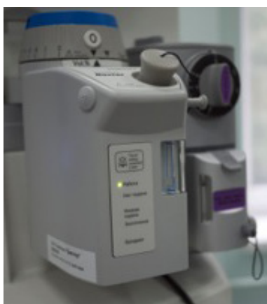
Рис. 3. Ингаляционная анестезия отрабаты- вается на роботесимуляторе HPS с имитацией газообмена и всасывания ингаляционных анестетиков