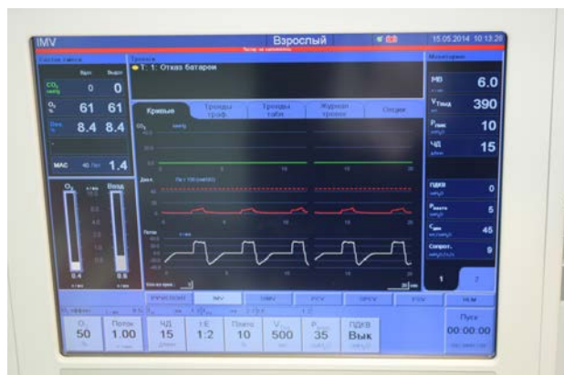
Рис. 5. Следящий монитор