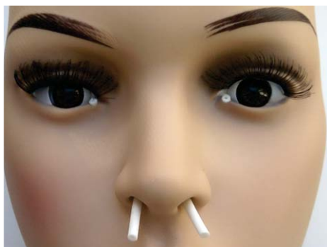
Илл.1. Детский вариант тренажера, с учетом анатомических особенностей новорожденного