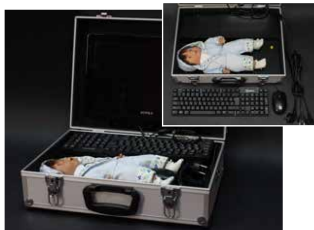
Илл.1. Внешний вид аппаратно-программного комплекса

Конструктивное решение выполнено в виде переносного компактного варианта, размещенного в кейсе. Внутри кейса находится манекен - силиконовая кукла, соответствующая по размерам грудному ребенку, блок генерации изображения и оптический блок, соединенные с компьютером пользователя (илл.1).