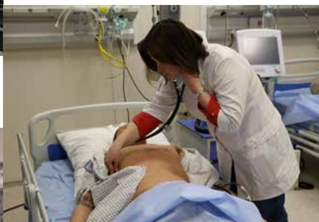
Терапевт отрабатывает акупунктурные навыки. Клиника интенсивной терапии и реанимации