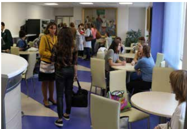
В перерыве между занятиями