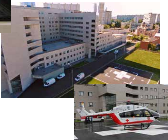
ГБУЗ Городская клиническая больница им. С.П. Боткина Департамента здравоохранения города Москвы