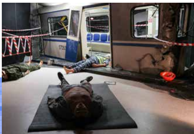
Имитация аварии в метрополитене. Клиника медицины катастроф