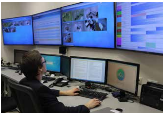
Высокотехнологичный программно-аппаратный комплекс «Learning Space». Центр управления МСЦ Боткинской больницы