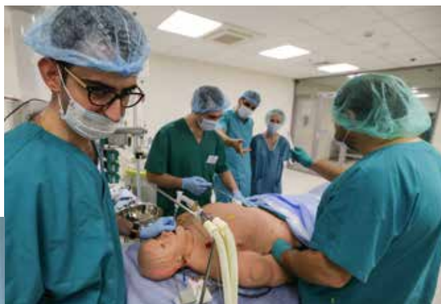
Бригада врачей отрабатывает командное взаимодействие. Клиника анестезиологии