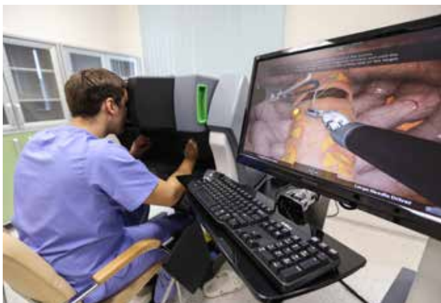
Хирург проводит операцию на симуляторе Mimic. Клиника роботической хирургии