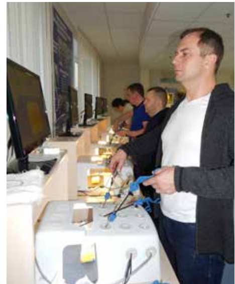
Рис. 5. Освоение методики интракорпорального шва на коробочном тренажере

отслеживать эффективность обучения, сравнивать, применять соревновательность как мотивационную методику в обучении.