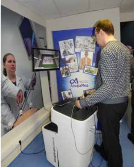
Рис. 4. Отработка практических навыков с помощью компьютерного симулятора