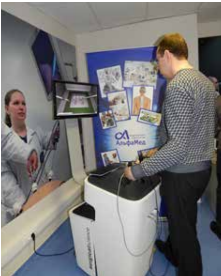
Рис. 4. Отработка практических навыков с помощью компьютерного симулятора