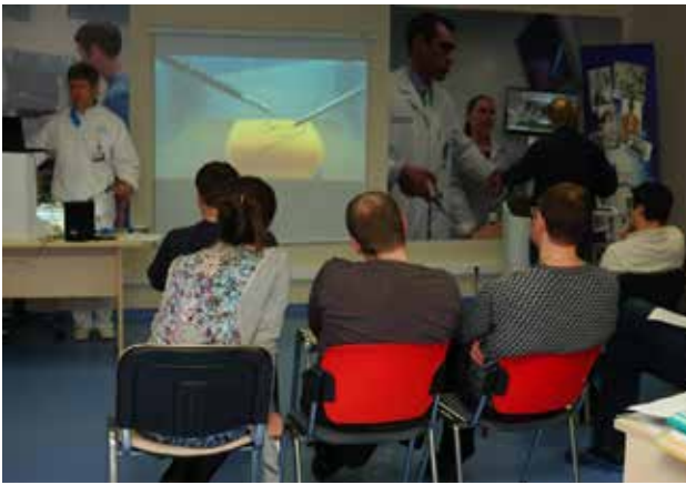
Рис. 2. Демонстрация на экране проектора наиболее сложных элементов упражнений. Трансляция с коробочного тренажера преподавателя

сти электронного обучения с помощью известных интернет-ресурсов. Только после прочного освоения базового уровня навыков эндовидеохирургии и прохождения соответствующей аттестации хирург может быть допущен до самостоятельной хирургической деятельности.