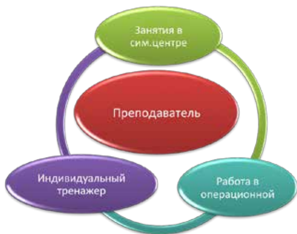
Рис. 1. Структурная схема совершенствования практических навыков в эндоскопической хирургии

В течение года на базе Всероссийского центра экстренной и радиационной медицины им. А.М. Никифорова МЧС России, расположенного в Санкт-Петербурге, функционирует центр симуляционного обучения. Он состоит из нескольких модулей: модуля радиационной безопасности, центра авиамедицинской эвакуации, класса обучения спасателей и фельдшеров скорой помощи, класса электронного об-