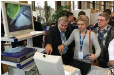
Медицинский аттестационно-симуляционный центр ФГБУ ДПО «Центральная государственная медицинская академия» Управления делами Президента РФ