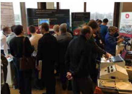
Учебная секция съезда вызвала огромный интерес. На фото на заднем плане стенды УЦИМТ РНИМУ Пирогова и Казанского Образовательного центра высоких медицинских технологий.