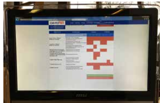
На экране монитора страница онлайн-записи на сайте Синтомеда на учебные мини-курсы симуляционных центров в ходе съезда РОЭХ. Заполнение - 100%.