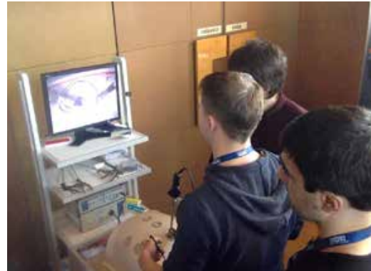
Учебный центр кафедры эндохирургии МГМСУ им. А.И. Евдокимова