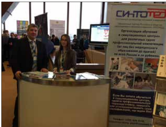
Стенд компании СИНТОМЕД на XIX съезде РОЭХ (Москва, 2016)

Члены общероссийской общественной организации «Российское общество симуляционного обучения в медицине», РОСОМЕД неоднократно ставили данный вопрос перед Правлением общества, поэтому было решено разработать единую, централизованную систему интеграции центров.