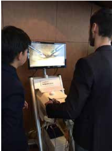
Центр непрерывного образования Первого МГМУ им. И.М. Сеченова. На фото слева: отработка упражнений на виртуальном симуляторе. На фото справа: проводится валидация курса БЭСТА, Базовый эндохирургический симуляционный тренинг и аттестация.