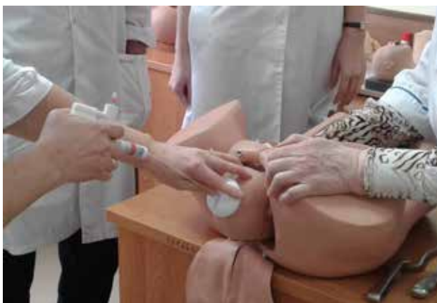
Рисунок 2. Симуляционный тренинг вакуум-экстракции плода

Анализ карт показал, что исходный уровень самооценки по выполнению практических навыков составил – 31,1±0,9 балла, тогда как после проведенного цикла отмечено достоверное повышение данного