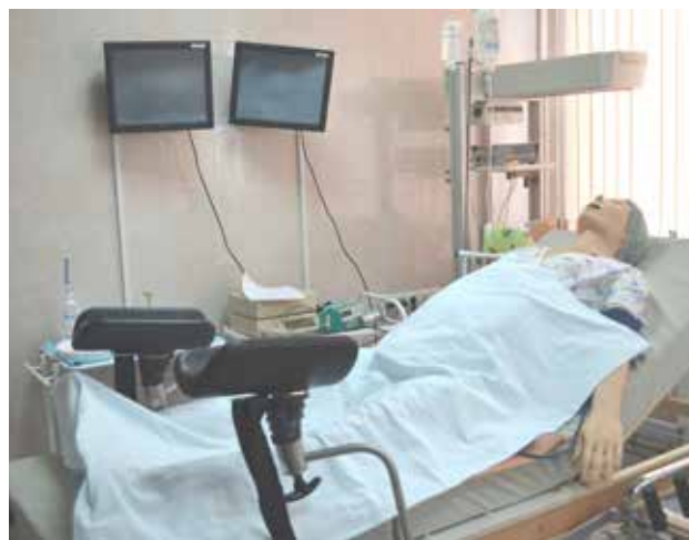
Рисунок 3. Учебный класс, имитирующий родильный зал с манекеном-имитатором пациента