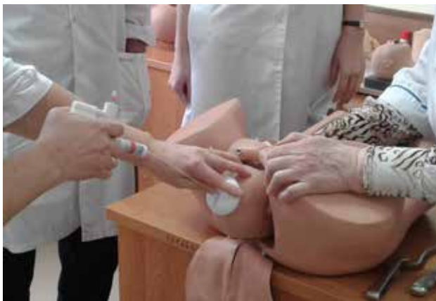
Рисунок 2. Симуляционный тренинг вакуум-экстракции плода

Анализ карт показал, что исходный уровень самооценки по выполнению практических навыков составил – 31,1±0,9 балла, тогда как после проведенного цикла отмечено достоверное повышение данного