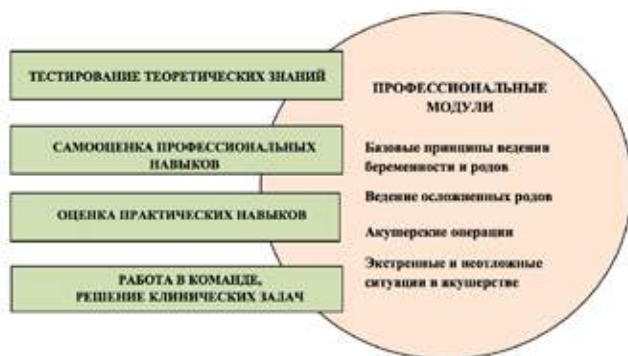
Рисунок 1. Схема учебного процесса на цикле ПК «Клиническое акушерство (практический курс с использованием симуляционных платформ и тренажеров родов)»

С 2013 года на кафедре акушерства и гинекологии, неонатологии, анестезиологии и реаниматологии ФГБУ «Ив НИИ МиД имени В.Н.Городкова» Минздрава России прошли обучение 306 врачей акушеров-гинекологов из 54 субъектов РФ на цикле повышения квалификации «Клиническое акушерство (практический курс с использованием симуляционных платформ и тренажеров родов)».