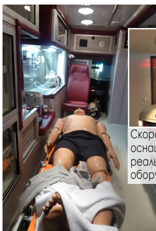
Скорая помощь оснащена реальным мед-оборудованием

ном происшествии с машиной Скорой помощи, реанимационные палаты, лаборатории отработки практических навыков, помещения для занятий со стандартизированными пациентами. Гордостью центра является роботхирургическая операционная, оснащенная системой daVinci. В медиа-центре возможно не только проведение лекций и семинаров, но и организация телеконференций с другими подразделениями центра и операционными лечебных учреждений страны. Управление осуществляется с помощью системы менеджмента центра Learning Space.