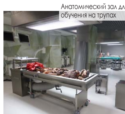
Анатомический зал для обучения на трупах