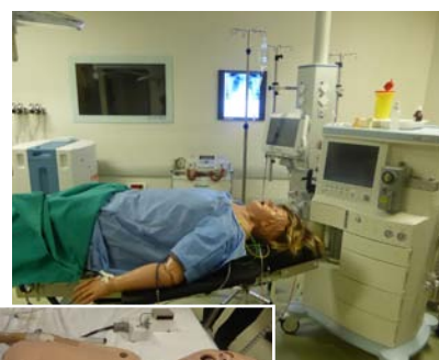
Роботы-симуляторы пациентов взрослых и детей высшего класса реалистичности.