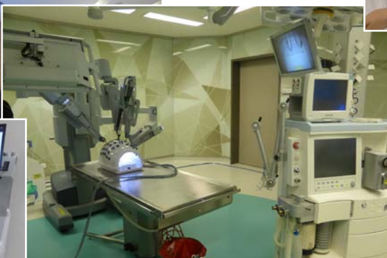
Тренинг хирургических навыков проводится на виртуальных симуляторах, тренажерах и реальном лапароскопическом и роботхирургическом оборудовании с применением лабораторных животных (свиней)