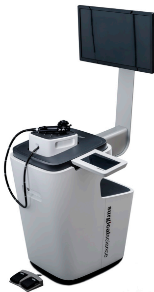
Виртуальный симулятор внутрипросветной эндоскопии EndoSim

Компания Surgical Science (Гётеборг, Швеция) оснастила свой новейший виртуальный симулятор ЭндоСим отдельным блоком упражнений, созданным согласно требованиям курса «FES - Fundamentals of Endoscopic Surgery» (Основы эндоскопической хирургии). Учебные задания блока (Навигация, Оценка состояния