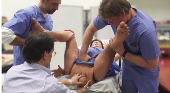
Симуляционное обучение родовому пособию с помощью робота-симулятора FIDELIS компании CAE Healthcare

Компания CAE Healthcare представила первый в мире робот-симулятор роженицы. Модель физиологии имеет две взаимосвязанные составляющие - роженицы и плода. Когда страдает мать или плод, нарушение их состояния оказывает влияние друг на друга: введение лекарств и иные воздействия на организм матери влияют на статус ребенка, а изменение состояния плода (гипоксия и пр.) - оказывает влияние на жизненные показатели женщины. Реалистичная конструкция робота позволяет выполнять влагалитное обследование, прием Леопольда, массаж атоничной матки, родовое пособие при головном и тазовом предлежании в норме и при патологических родах, а также проводить комплекс лечебно-реанимационных мероприятий (ларингоскопию, интубацию, искусственную вентиляцию).