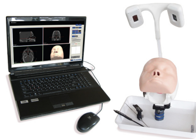
Симуляционная система ФаконЛОР для операций на придаточных пазухах носа

стичными материалами тактильные ощущения хирургических вмешательств воспроизводятся практически на 100%. Гибридная система позволяет отрабатывать операции на позвоночнике, основании черепа и придаточных пазухах носа в нейрохирургии, ортопедии и ЛОР-хирургии.