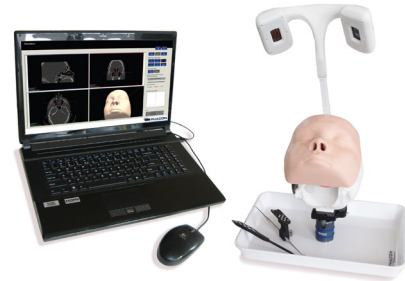
Симуляционная система ФаконЛОР для операций на придаточных пазухах носа

стичными материалами тактильные ощущения хирургических вмешательств воспроизводятся практически на 100%. Гибридная система позволяет отрабатывать операции на позвоночнике, основании черепа и придаточных пазухах носа в нейрохирургии, ортопедии и ЛОР-хирургии.