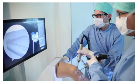
Симулятор ArthroS, VirtaMed

различным клиническим темам и практической демонстрации умений на виртуальном симуляторе с их объективной оценкой.