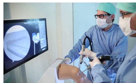
Симулятор ArthroS, VirtaMed

Швейцарская Сертификационная Палата (Swiss Board Certification) приняла решение о включении в сертификационный экзамен ортопедов-травматологов тестирования на виртуальном симуляторе. Швейцарское общество ортопедии и травматологии впервые в мире провело экзамен у 77 кандидатов с применением артроскопического симулятора ВиртаМед АртроС. Экзамен состоял из двух частей: устного собеседования по различным клиническим темам и практической демонстрации умений на виртуальном симуляторе с их объективной оценкой.