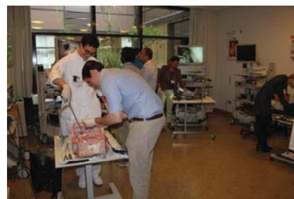
В небольшой комнате размещено несколько учебных эндовидеохирургических стоек

В центре нет виртуальных симуляторов. Несмотря на то, что к курсантам часто подходят наставники, 100%-контроля не было, и не все ошибки и неправильные действия отслеживались и корректировались (например, коагуляции без контакта инструмента с тканью, неточным или небезопасным наложением клипсы, движения инструментов вне поля зрения). Отсутствие постоянной дидактической помощи (в виртуальных симуляторах она обеспечивается подсказками на экране) способствовало развитию и закреплению ложных приемов и навыков. Отсутствовала объективная оценка выполнения вмешательств и роста уровня практического мастерства. По словам руководителя курса, они были бы рады иметь виртуальные симуляторы, но позволить себе их не могут по экономическим соображениям. Тем не менее, в ближайших планах стоит приобретение одного аппарата – главным образом, для тренинга собственных сотрудников Университетской клиники.