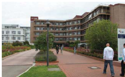
Один из корпусов клиники

лапароскопических инструментов. Поставлялся с набором базовых упражнений и модулем лапароскопической холецистэктомии. Лицензия на его дистрибуцию была приобретена небольшой немецкой фирмой, однако вследствие просчетов в маркетинге и высокой цены симулятор так и не получил широкого распространения, и через несколько лет его производство было прекращено.