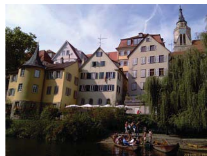
Набережная реки Некар – визитная карточка университетского городка

Если Вы хотите, чтобы информация о Вашем учреждении была опубликована на страницах журнала или хотели бы видеть репортаж о другом известном Вам центре, пожалуйста, напишите нам на электронную почту info@medsim.ru