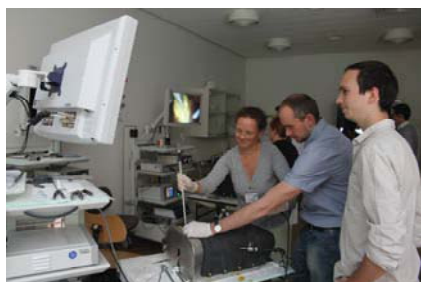
На двух курсантов приходится по одному инструктору

Оба препарата фиксировались проволокой к внутренней решетке оригинального тренажера Tübingen MIS-Trainer. Его конструкция позволяет проводить Wet-Lab тренинг – с применением влажных моделей. Жидкости (кровь, желчь) собираются в поддоне и эвакуируются через отверстие в нем, а при использовании перистальтического насоса имитируется пульсация и кровотечение сосудов.