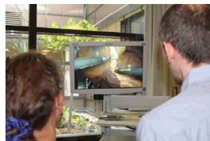
На одном рабочем месте – по два курсанта

Длительность занятия два с половиной дня, 6-10 курсантов на цикл. Стоимость курса составляет 295 ЕВРО (в нее входит обучение, расходные материалы и три обеда в кафетерии клиники). По окончании обучения выдает сертификат и присваиваются СМЕ-баллы.