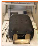
Фиксация в тренажере биологической модели

Оба препарата фиксировались проволокой к внутренней решетке оригинального тренажера Tübingen MIS-Trainer. Его конструкция позволяет проводить Wet-Lab тренинг – с применением влажных моделей. Жидкости (кровь, желчь) собираются в поддоне и эвакуируются через отверстие в нем, а при использовании перистальтического насоса имитируется пульсация и кровотечение сосудов.