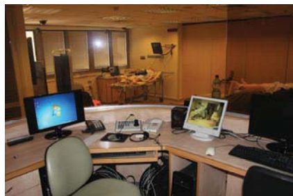
Комната контроля за симуляционным занятием

В мае 2012 года делегация РОСОМЕД посетила Медицинский симуляционный центр МСР Шеба. Это был интересный и познавательный визит, поскольку центр хорошо известен в Израиле и в нашей стране. К сожалению, визит был недолгим – возможность осмотреть свой центр хозяева оценивают в 1.000 долларов за полуторачасовую экскурсию.