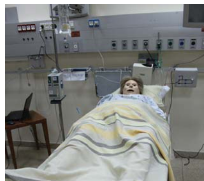
Манекен для отработки родового пособия

Помимо учебной, в центре ведется и научная работа – за годы существования центра было написано 4 диссертации на степень PhD и 2 работы на степень магистра управления.