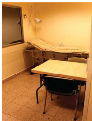
Палата работы со стандартизированными пациентами