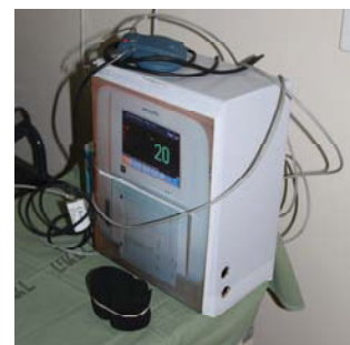
Мониторы в палатах занятий со стандартизированными пациентами выполнены из обувных картонных коробок

часть занята небольшими смотровыми комнатами для работы со стандартизированными пациентами, в коридорах размещены ряды компьютерных рабочих мест. Также была продемонстрирована учебная операционная и несколько комнат с манекенами-имитаторами пациента среднего класса. Некоторые из учебных комнат снабжены зеркальными окнами с односторонней проводимостью и видеокамерами для наблюдения за учебным процессом. Всего в центре около 30 видеокамер, они связаны в единую сеть. Оборудования в центре довольно много, есть и медицинская техника – дефибрилляторы, аппараты ИВЛ, другая аппаратура; по ее состоянию видно, что центр работает активно, напряженно.