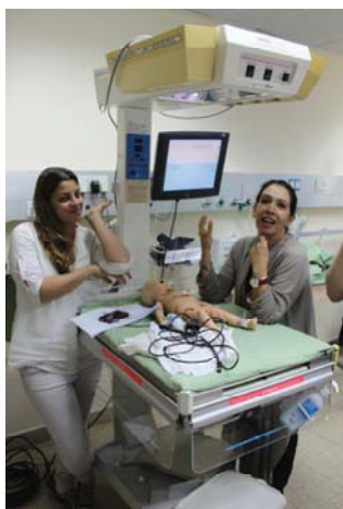
Сотрудники центра разрабатывают учебный сценарий по неонатологии

Центром ведется методическая работа, подготовлено более 50 симуляционных клинических сценариев, которыми охотно он готов поделиться, правда, не бесплатно. По словам директора по маркетингу, стоимость одного составляет от 2 до 10 тысяч долларов, то есть приобретение пакета сценариев обойдется в несколько сотен тысяч долларов, но при этом в стоимость входит приезд специалиста и его консультационная работа в течение нескольких дней.